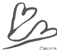
Cœurs, par Maya

« Avec mon élu, j'ai fait une alliance, j'ai juré à David, mon serviteur : J'établirai ta dynastie pour toujours, je te bâtis un trône pour la suite des âges.