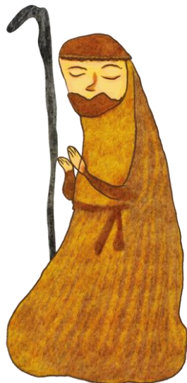
St Joseph, par Albert

5. L'heure est venue d'affermir votre cœur ! Voici le temps d'espérer le Seigneur ! Il est tout près, il vous appelle. Il vous promet la vie nouvelle.