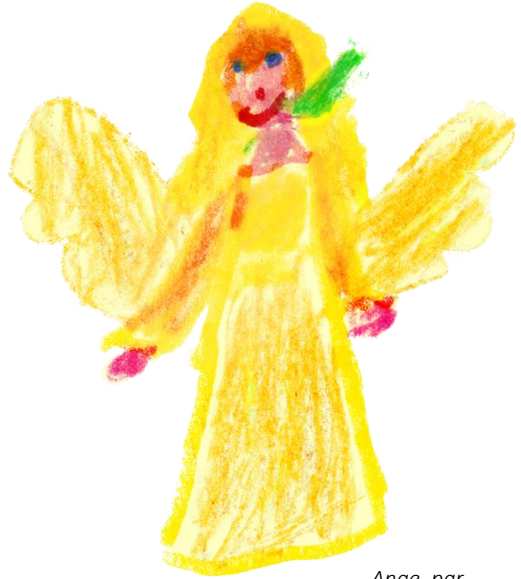
Ange, par Victoire

3. Il apporte à notre monde La paix, ce bien si précieux. Qu'aujourd'hui nos cœurs répondent Pour accueillir le don de Dieu.