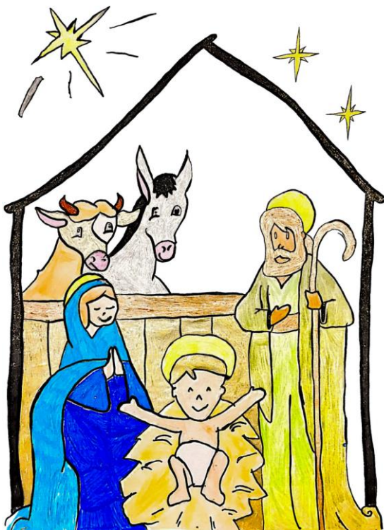
Nativité, par Mathéo

3. Qu'il revienne à la fin des temps, nous conduire à la joie du Père, Qu'il revienne à la fin des temps et qu'il règne éternellement.