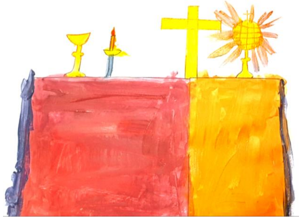
Table eucharistique, par Chahinez

5. Soyez mes témoins, je vous ferai pécheurs d'hommes. Je suis avec vous pour toujours, n'ayez pas peur. entris generosi rex effudit gentium.