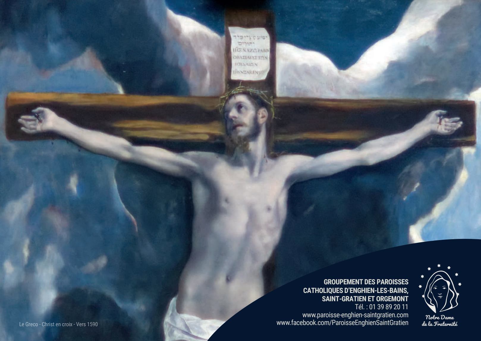
Le Greco - Christ en croix - Vers 1590

GROUPEMENT DES PAROISSES CATHOLIQUES D'ENGHIEN-LES-BAINS, SAINT-GRATIEN ET ORGEMONT